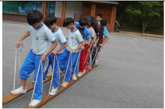
說明：潛力開發營-大腳哈利