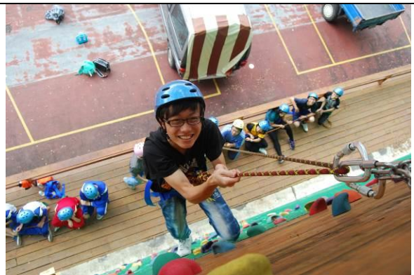
說明：潛力開發營-攀岩