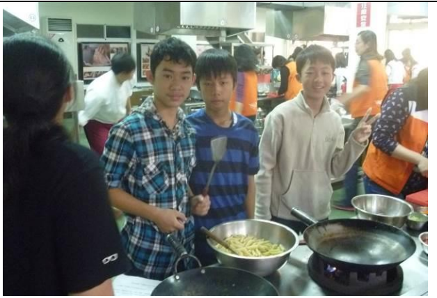
說明：菁英培訓營-美味人生