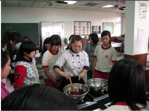
說明：菁英培訓營-烘焙王