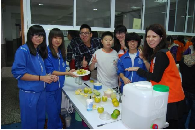
說明：菁英培訓營-創意飲調