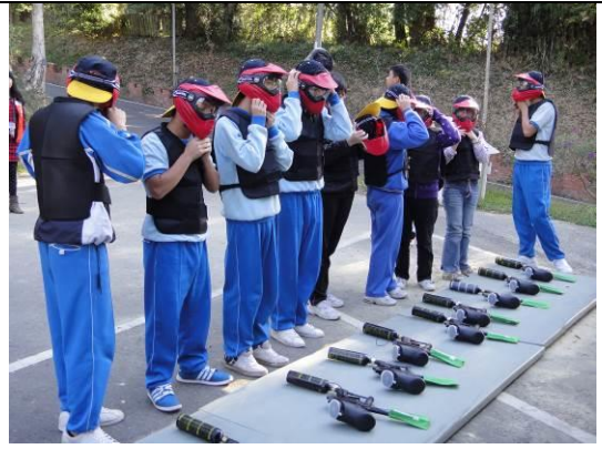
說明：潛力開發營-漆彈射擊